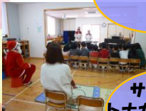
サンタさん トナカイさんにも 会えました!